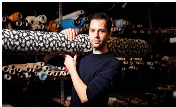
On y trouve du tissu mais aussi des cuirs, des dentelles, des milliers de boutons.