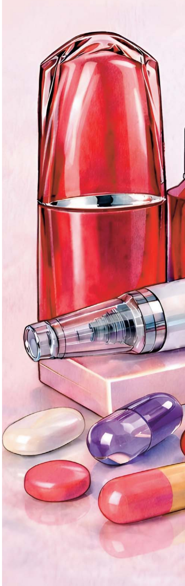
ILLUSTRATION RÉALISÉE PAR UNE INTELLIGENCE ARTIFICIELLE (CHATGPT®) - CRÉDIT: ROULARTA MEDIA GROUP