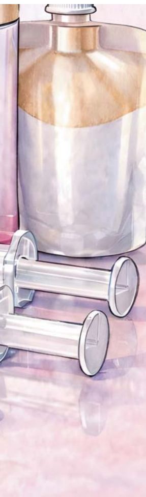
ILLUSTRATION RÉALISÉE PAR UNE INTELLIGENCE ARTIFICIELLE (CHATGPT) - CRÉDIT: ROUJARTA MEDIA GROUP

plus de 3,1 millions de pilules, 104.000 colis illicites, 23.014 ampoules ou flacons et plus de 1.000 kilos de produits ont été confisqués. A l'échelle mondiale, Pangea XVII, coordonnée par Interpol dans 90 pays, a abouti en 2025 à la saisie de 50,4 millions de doses illicites, à 769 arrestations, au démantèlement de 123 groupes criminels et à la fermeture d'environ 13.000 sites, pages, canaux ou bots servant à vendre ces produits.