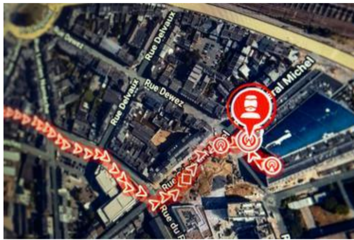
Sur l'écran, les flèches rouges dessinent le trajet d'un justiciable.

«On va faire le test de périmètre maintenant», reprend-il. Le jeune homme se redresse légèrement. «Restez près de l'appareil pendant que je lance le système... Voilà... Parfait... Maintenant, vous allez dans la première chambre et vous y restez deux minutes. Ensuite la deuxième. Puis la salle de bain.» Le justiciable s'exécute. Le bip de l'appareil valide tous les coins de son appartement. «Ça nous permet de vérifier que le bracelet capte bien partout... Voilà, tout est en ordre... Bonne continuation», conclut Youssef. Le justiciable hésite un instant : «Je ne peux pas vous raccompagner à la sortie alors ?» «Non, ce n'est pas nécessaire. Je connais le chemin», répond l'agent avec un léger sourire, ajoutant à voix basse : «Certains essaient toujours de tester les limites du système pour voir si cela va envoyer une alerte au centre... Il faut du caractère pour faire notre travail. On doit être tolérants mais fermes, sinon ils essaient de grappiller des avantages : "Je peux avoir