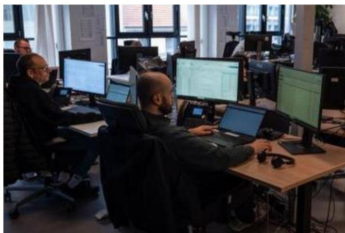
Au sein de la Direction de la surveillance électronique, 45 agents assurent le monitoring en continu, jour et nuit.