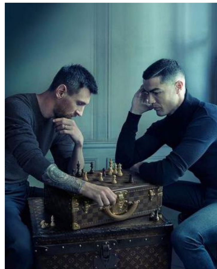
Les aficionados reconnaissent dans l'agencement des pièces du jeu d'échecs une partie mythique de 2017. Entre les icônes Carlsen et Nakamura.

LVMH entend utiliser cette photo pour lancer une campagne de publicité baptisée « la victoire est un état d'esprit ». En revanche, il ne faudra pas trop compter sur la firme pour apprendre comment elle a procédé pour convaincre les deux footballeurs de poser ensemble, connaître le budget de l'opération et expliquer comment le scénario de la partie d'échec a été imaginé. A toutes ces demandes d'informations, le service de presse du groupe nous a répondu qu'il ne souhaitait ni commenter la symbolique de la photo ni dévoiler le moindre détail sur les coulisses de l'opération.