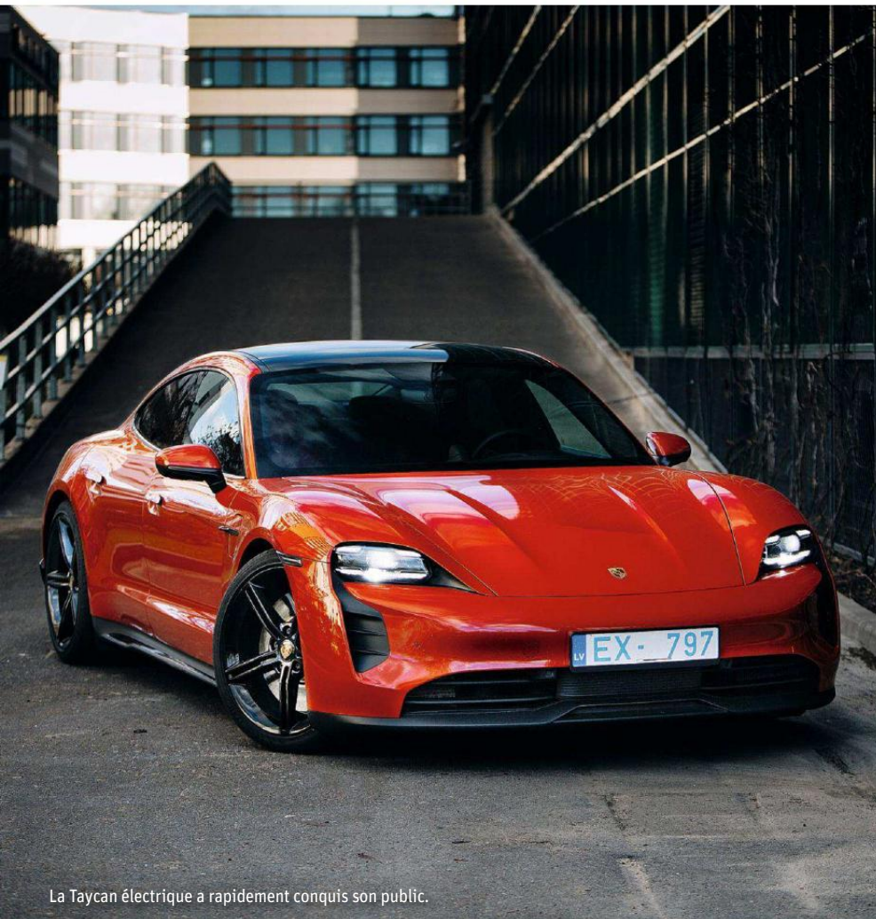
La Taycan électrique a rapidement conquis son public.

Le fabricant de bolides qu'est Porsche se convertit quant à lui progressivement à l'électrique, avec le "Tycan" dont il a écoulé près de 20000 exemplaires de janvier à juin, une nouvelle "Macan" électrique attendue en 2024 et le lancement d'un nouveau SUV au milieu de la décennie. (AFP)