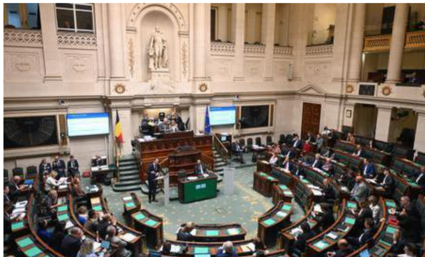
Des citoyens tirés au sort dès 18 ans feront bientôt leur entrée dans l'enceinte du Parlement fédéral, au même titre que les députés.

Le pouvoir judiciaire sera également exclu du processus, dans le respect du principe de séparation des pouvoirs qui distingue les personnes qui font les