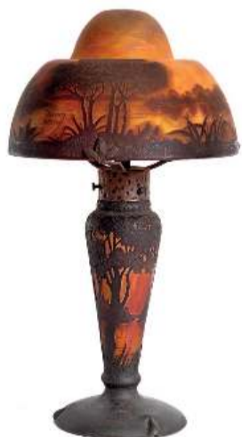
DAUM - Nancy