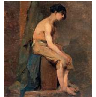
James ENSOR (1860-1949)