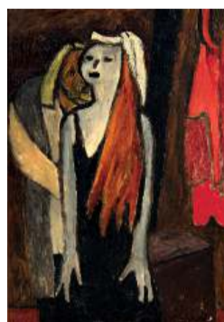
Joseph CZAPSKI (1896-1993)