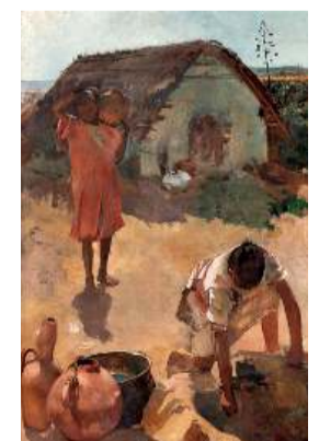
Theo VAN RYSELBERGHE (1862-1926)