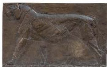
D'après Rembrandt BUGATTI (1884-1916)