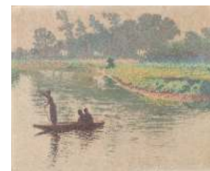
Emile CLAUS (1849-1924)