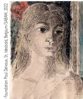
Paul DELVAUX (1897-1994)