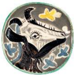
Pablo PICASSO (1881-1973)