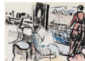
Rik WOUTERS (1882-1916)