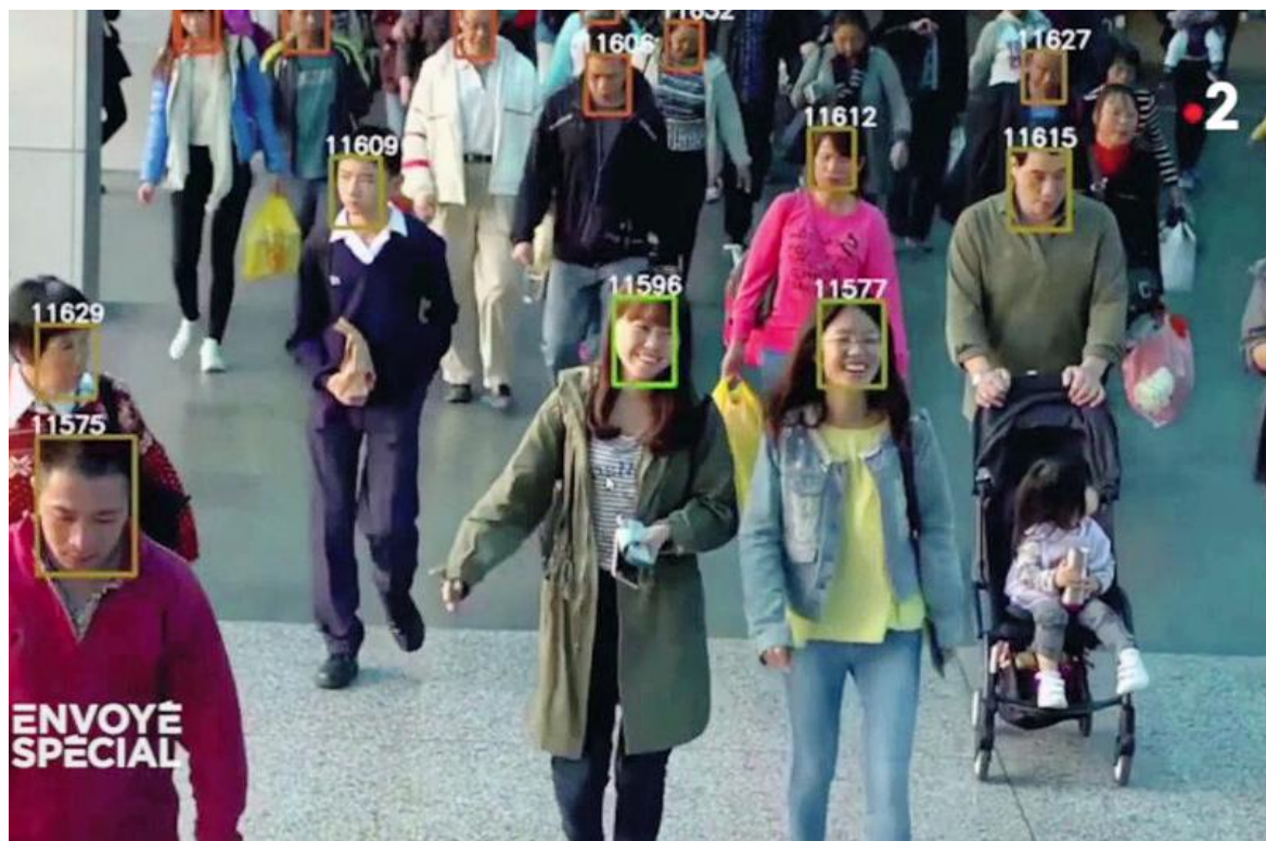
La Chine est à la pointe de la reconnaissance faciale avec ces caméras intelligentes capables d'identifier, dans une foule, le visage de n'importe quelle personne en quelques secondes.