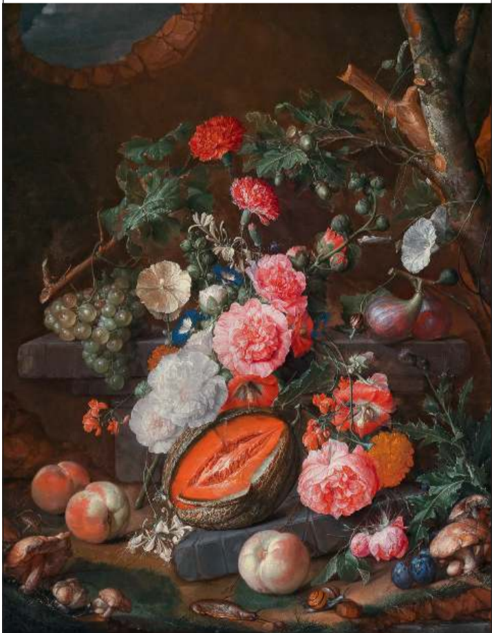
Cornelis de Heem (1631-1695), Fleurs et Fruits sur un Socle en Pierre , huile sur toile, 76 x 65,5 cm, € 250.000 - 350.000, vente 11 mai 2022

EXPOSITION A BRUXELLES 13 - 19 avril, 10-17h.